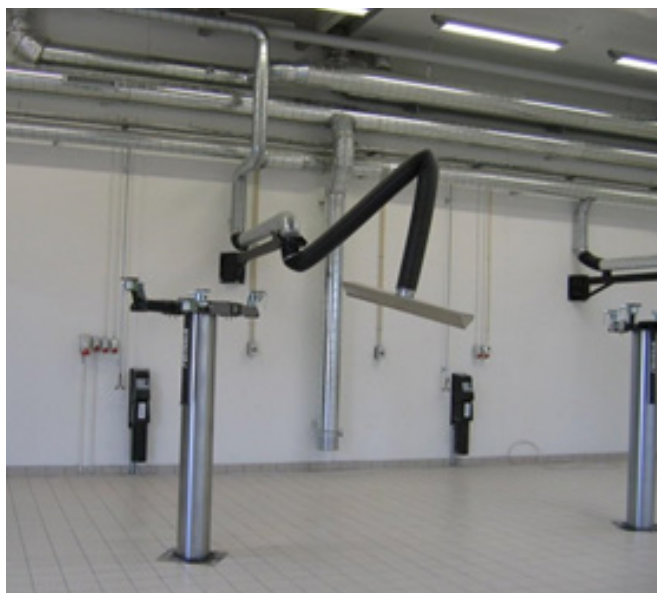
Værkstedsmiljø med spaltetragtudsugning.