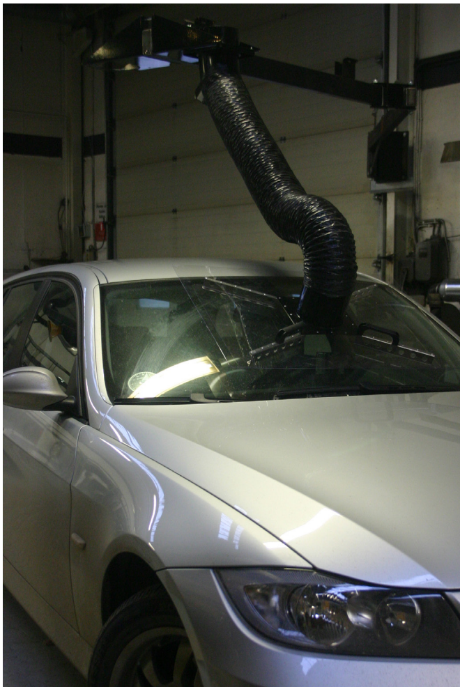
Rudelimsskærm i anvendelse