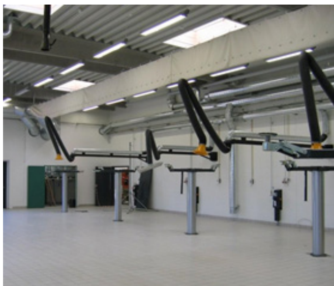
Værkstedsmiljø med spaltetragtudsugning.